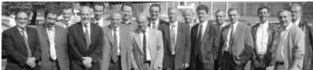
4 me AP GTPS. SPRIA - Tarbes (03/10/02)

Rappelons que deux Assemblées Plénières se sont tenues depuis notre dernière parution. La 73 me en avril 2002 nous a permis de nous rencontrer au CEA de Moronvilliers, dont nous avons pu apprécier la convivialité et la haute technologie lors de la visite de l'installation AIRIX, et la 74 me en octobre 2002 nous a fait découvrir les nouveaux locaux de nos amis de SPRIA à Tarbes dans une chaleureuse ambiance.